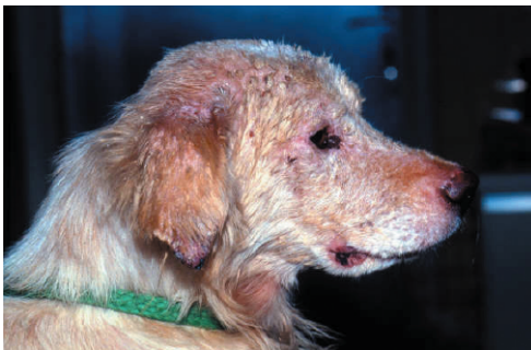
Hund mit Leishmaniose (li.), Malteser mit Augenentzündung (re. oben) und Spulwürmer im Dünndarm (re. unten)

Zoonosen wie Tollwut, Leishmaniose und Toxoplasmose gefährden Mensch UND Tier, Parasiten (Babesien, Spulwürmer, Bandwürmer etc.), bakterielle (Borelliose, Leptospirose, Salmonellose etc.) und virale Erkrankungen (Tollwut, Staupe, Parvovirose etc.) stellen ernstzunehmende Bedrohungen auch für andere Hunde dar.